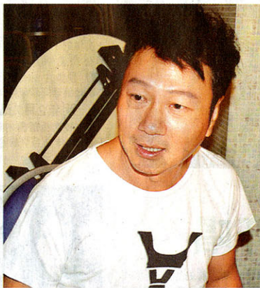
此趟回港后，想要一睹视帝祥仔的风采就要等到明年中甸的《丐》宣传活动中。

槟州首长林冠英和行政议员曹观友也在玮力产业集团主席兼首席执行官拿督刘永福陪同下，出席《丐》电影感谢宴，并为祥仔和辉哥饯行。